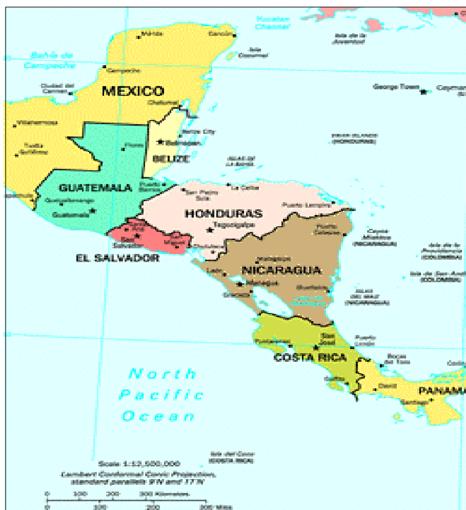
Mapa 2.1. Ubicación de Nicaragua en Centroamérica.

El área total del territorio nicaragüense es de 130,374 km 2 , correspondiendo 120,340 km 2 a tierra firme y 10,034 km 2 a lagos y lagunas costeras. Posee además una extensa plataforma continental submarina (200 m) que ocupa 72,700 km 2 adicionales 4 . Estas características convierten a Nicaragua en el país más extenso y menos densamente poblado de América Central.